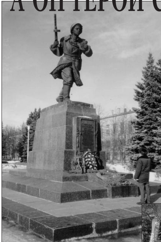
Памятник Александру Матросову. Великие Луки

70 лет (16.04.1934 г.) - золотой звездочке Героя великой страны. 13 тысяч награжденных или около (энциклопедии, как календари былых времен - всегда опаздывают или слегка путают). В строю их сегодня немного, хватит на всех торжественного зала: и актового, и банкетного. Все они, живые и мертвые, гордость народа, соленая соль земли Союза - смоленские, каширские, казанские, бухарские, карабахские и т.д.