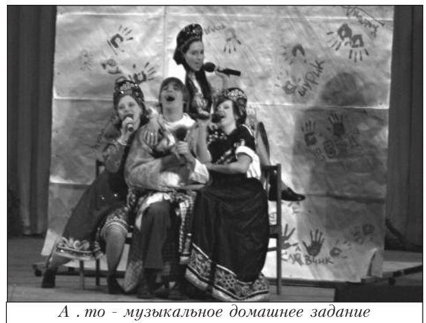
А . то - музыкальное домашнее задание