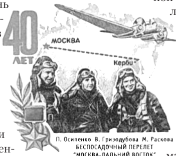
П. Осипенко В. Гриздубова М. Раскова БЕПОСАДОЧНЫЙ ПЕРЕЛЕТ "МОСКВА-ДАЛЬНИЙ ВОСТОК"