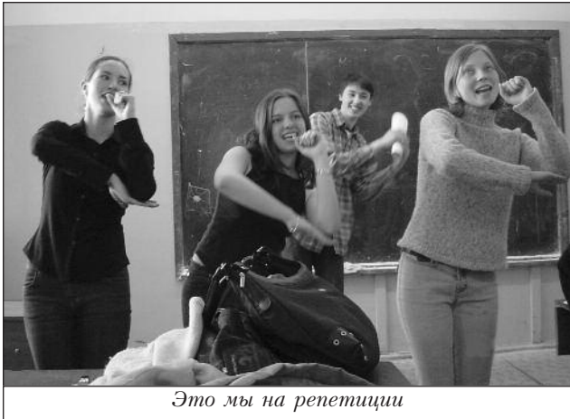
Это мы на репетиции

была на 15 марта, в 15 часов дня. Хорошее начало! Хотя в приметы мы не верим, но все знали, что это верный знак, и в четвертьфинал выйдут: или команда "Роза ветров", или "Красные в городе" из МГУ, или "Берегись автомобиля" из МАДИ, или "Dandi" из Лингвистического института, или сборная РГМУ из второго медицинского, или "Тихо шифром" из МИИТа, а, если повезёт, то и сборная РХТУ.