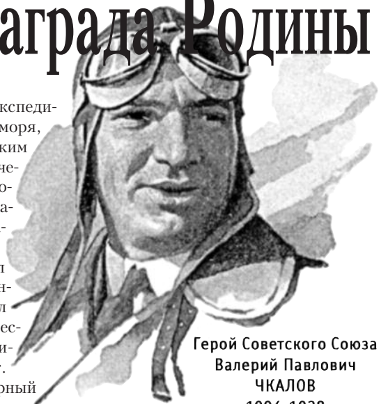
Герой Советского Союза Валерий Павлович ЧКАЛОВ 1904-1938