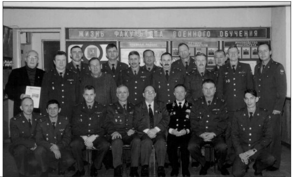
Коллектив - акультета военного обучени . ту - еврап п004 года

Но есть и другой ряд цифр, от него тоже никуда не уйти: 26 апреля 1986 года, 19 областей бывшего СССР, на которых проживали 4 миллиона 730 тысяч жителей, 5908 населенных пунктов подверглись радиоактивному заражению. Из оборота было выведено 144 тысячи гектаров сельхозугодий, прекращено лесопользование на 492 тысячах гектарах. Только за 3 года после катастрофы было затрачено 9,2 миллиарда тех еще, полновесных советских рублей. А за этими цифрами - другие: тысячи жизней унесла трагедия, десятки тысяч получили большие дозы облучения. Более 800 тысяч граждан СССР было привлечено к работам в 30 км зоне. И первыми там были военные. Свыше 210 соединений, частей, подразделений и учреждений общей числен-